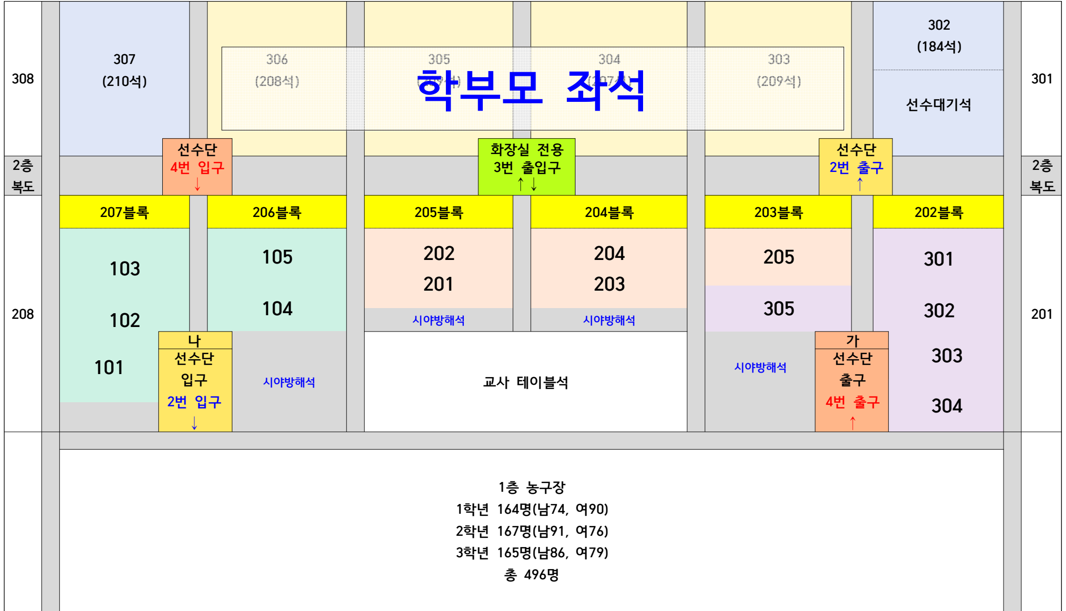
나. 학급별 좌석 배치도(농구장에서 바라봤을 때)